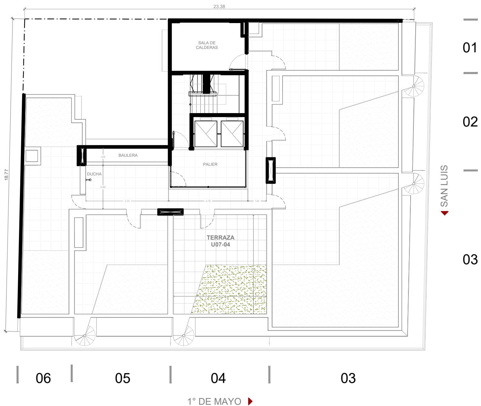
PLANTA AZOTEA 1:200